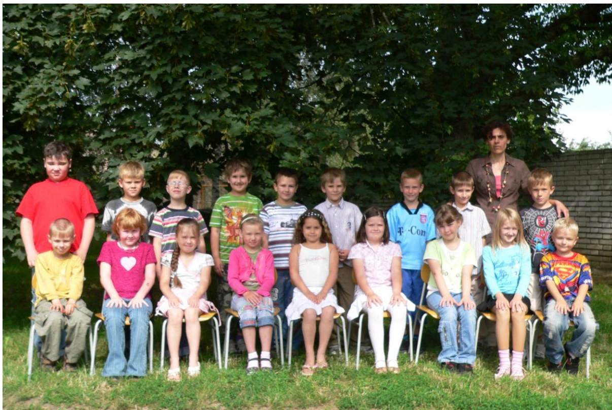
1. třída - školní rok 2007/2008