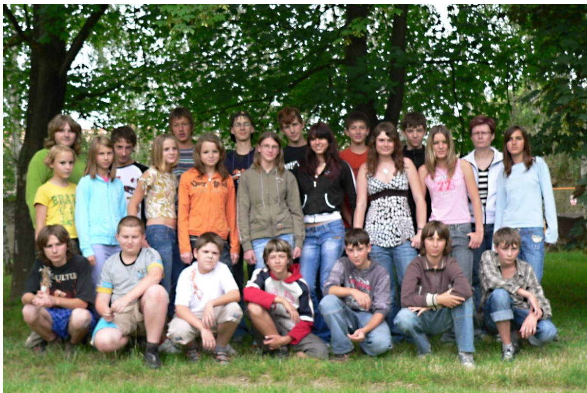
7. třída - školní rok 2007/2008