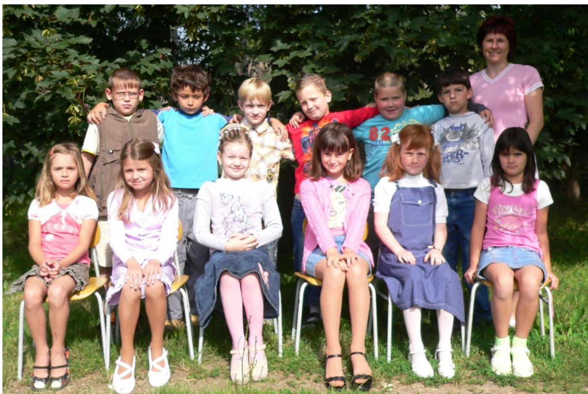
2. třída - školní rok 2007/2008