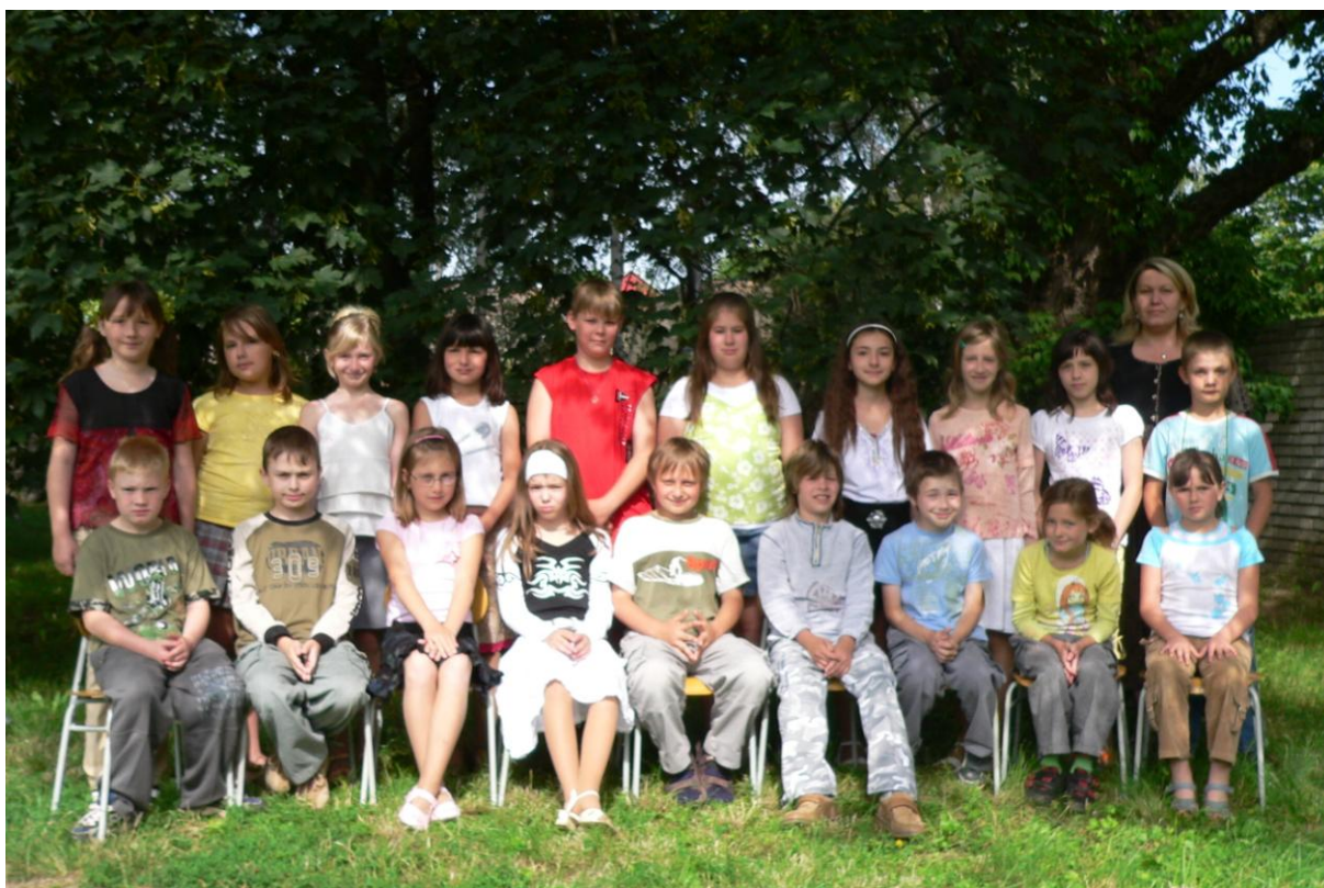
3. třída - školní rok 2007/2008