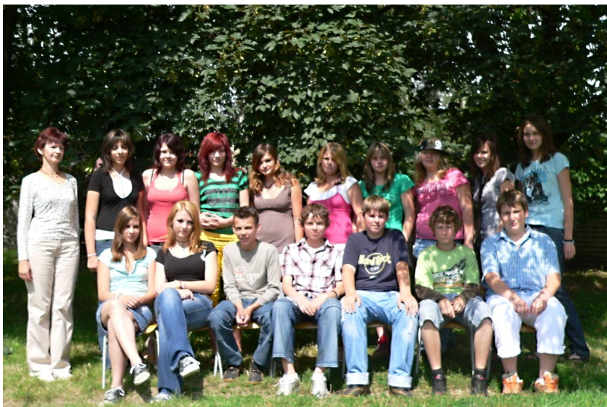
8. B - školní rok 2007/2008