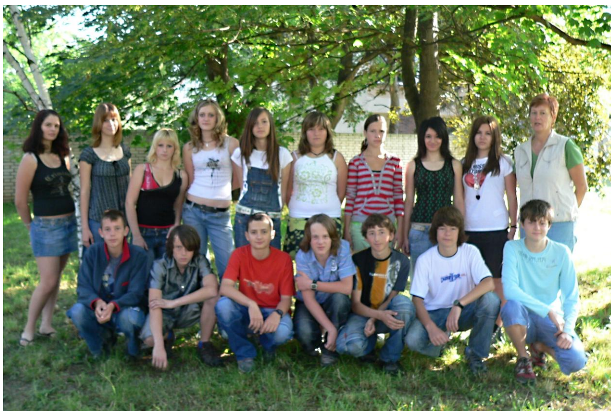
8. A - školní rok 2007/2008