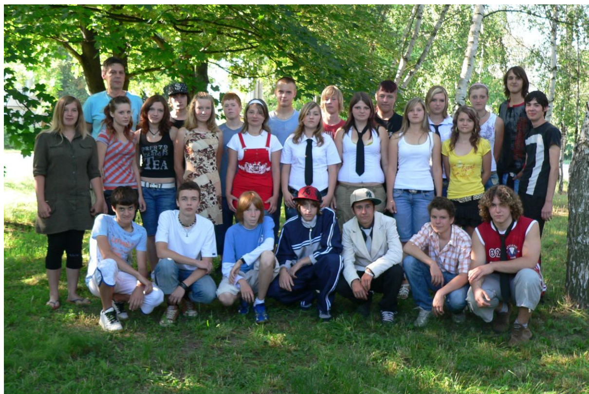
9. třída - školní rok 2007/2008