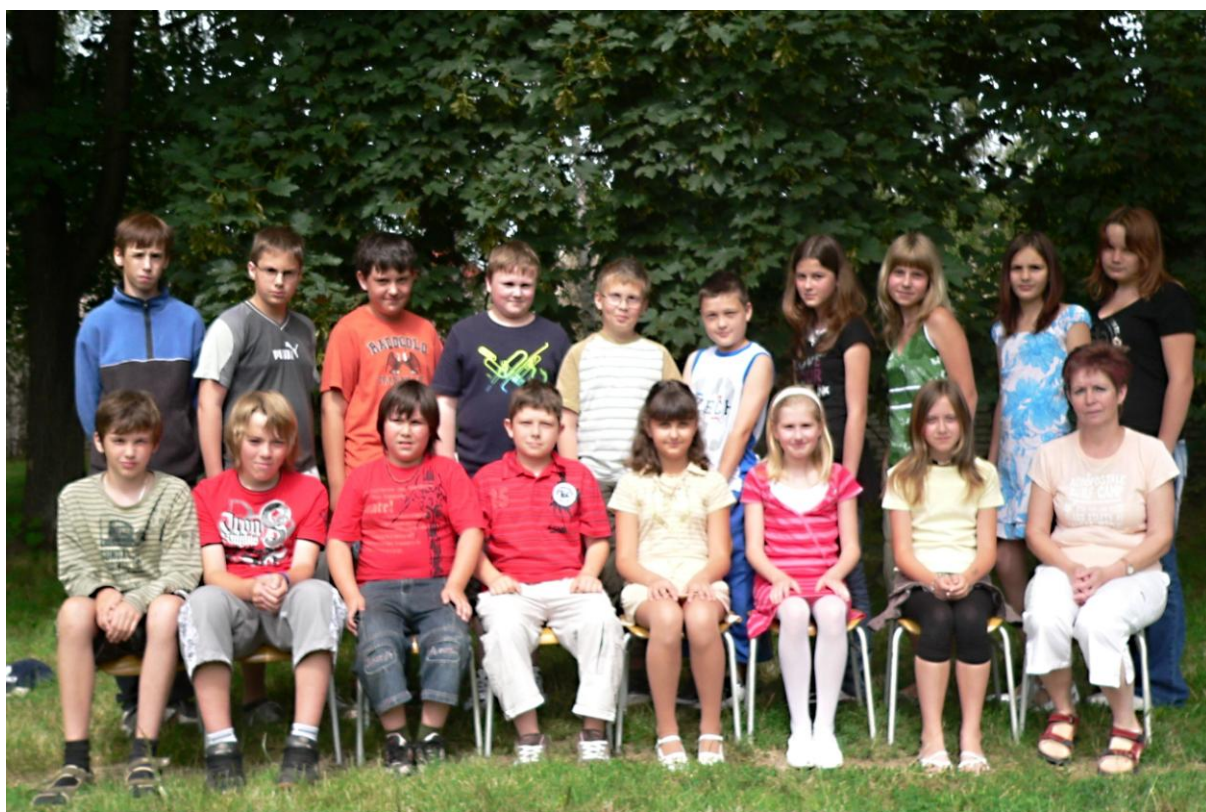
5. třída - školní rok 2007/2008