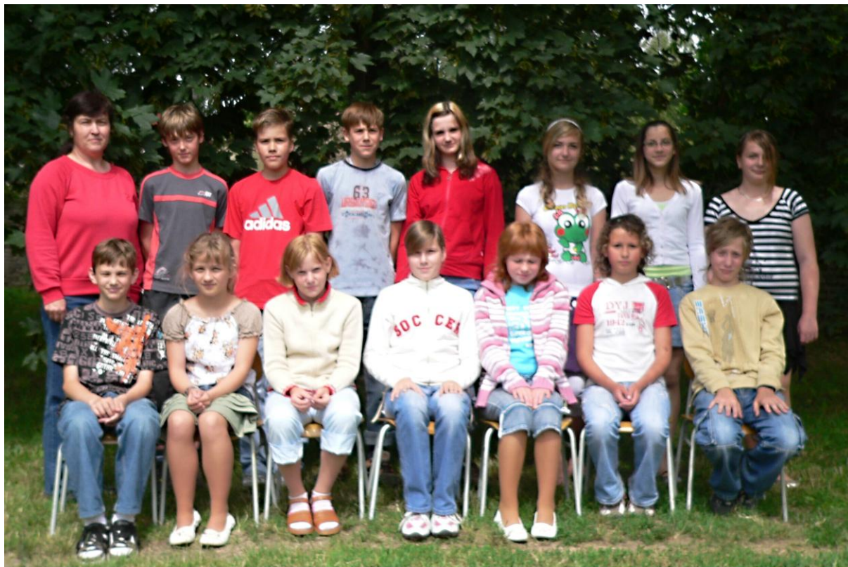
6. třída - školní rok 2007/2008