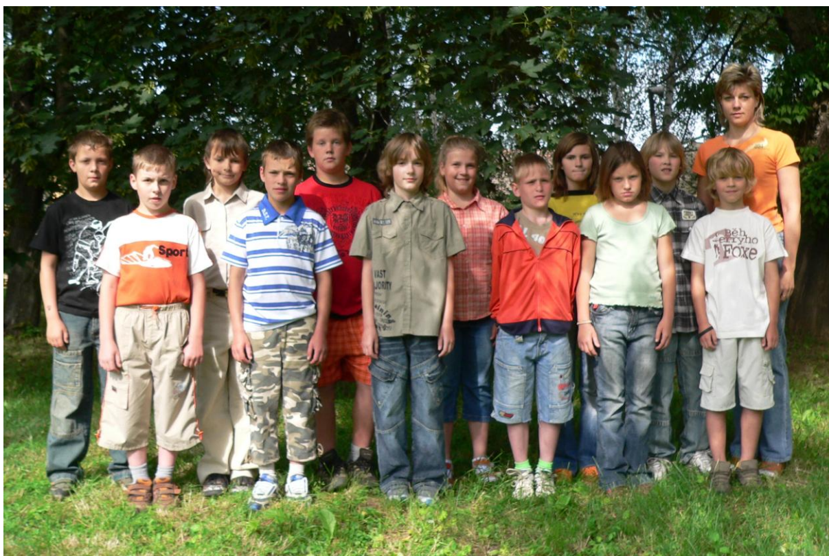
4. třída - školní rok 2007/2008