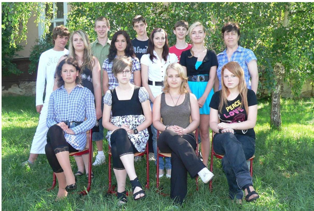
9. třída - 2010/2011