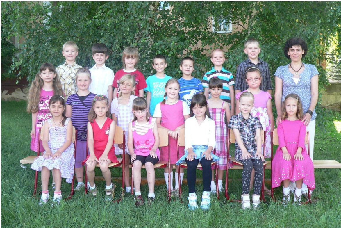
1. třída - 2010/2011