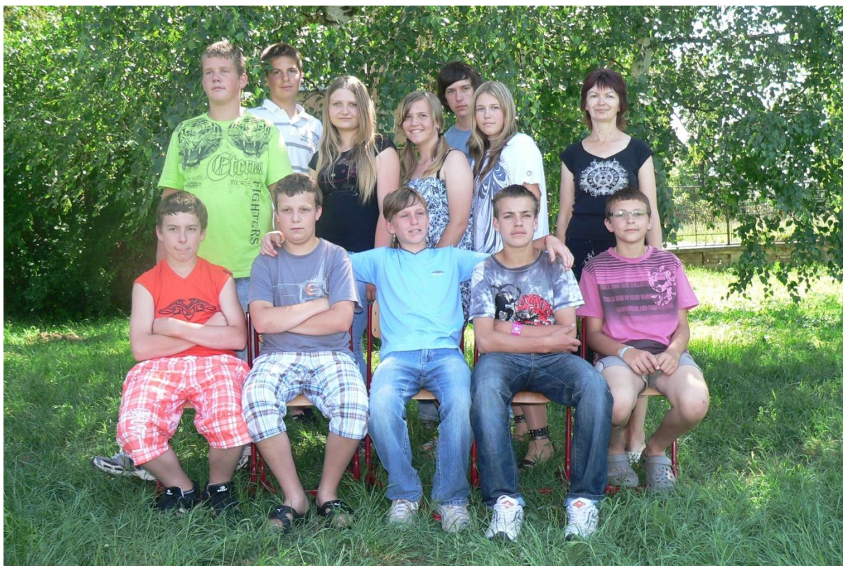
7. třída - 2010/2011