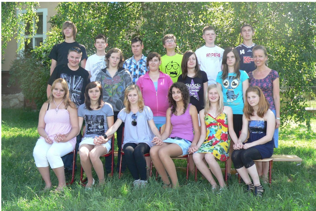
8. třída - 2010/2011