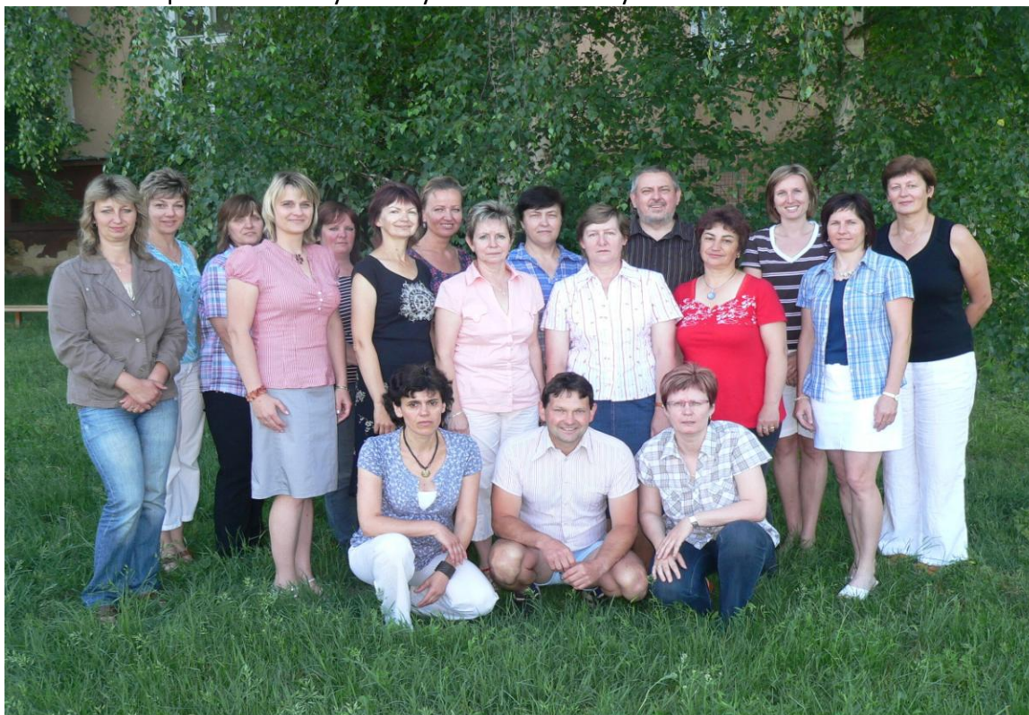
ZŠ Dyjákovice - 2010/2011

Poté odešli žáci do svých tříd a převzali od třídních učitelů vysvědčení. Na závěr vyprovodili žáci II. stupně absolventy 9. třídy ze školní budovy.