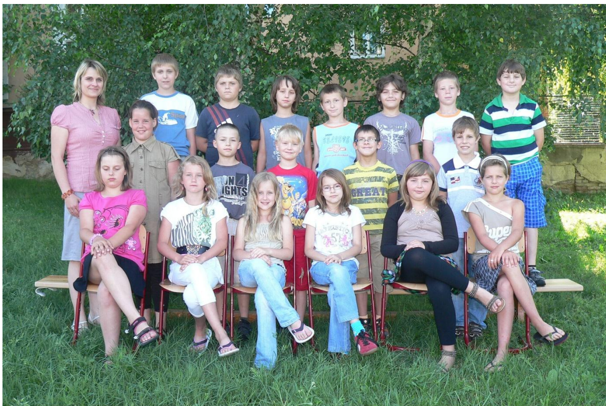
3. třída - 2010/2011