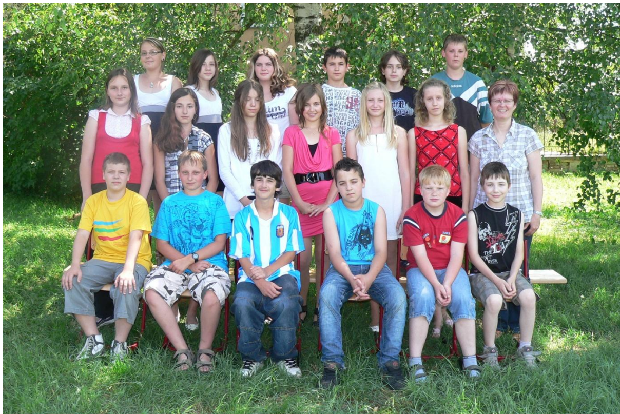
6. třída - 2010/2011