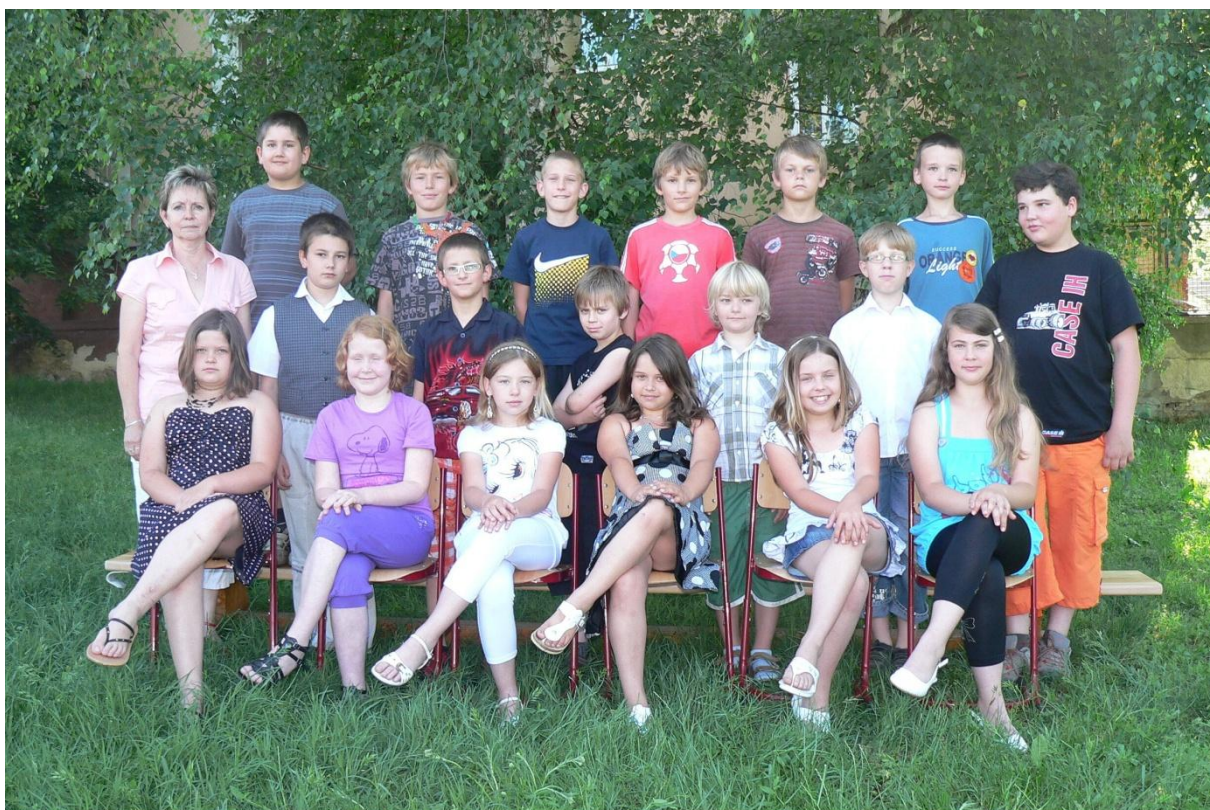
4. třída - 2010/2011