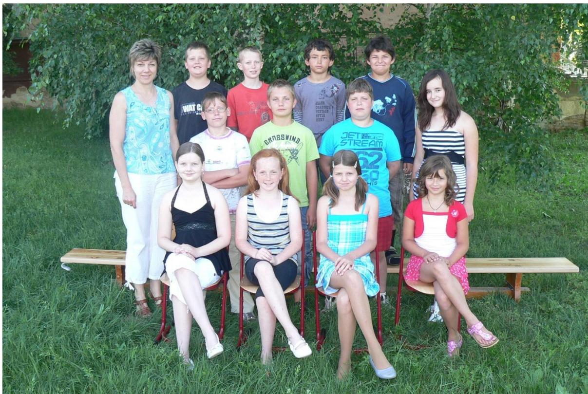
5. třída - 2010/2011