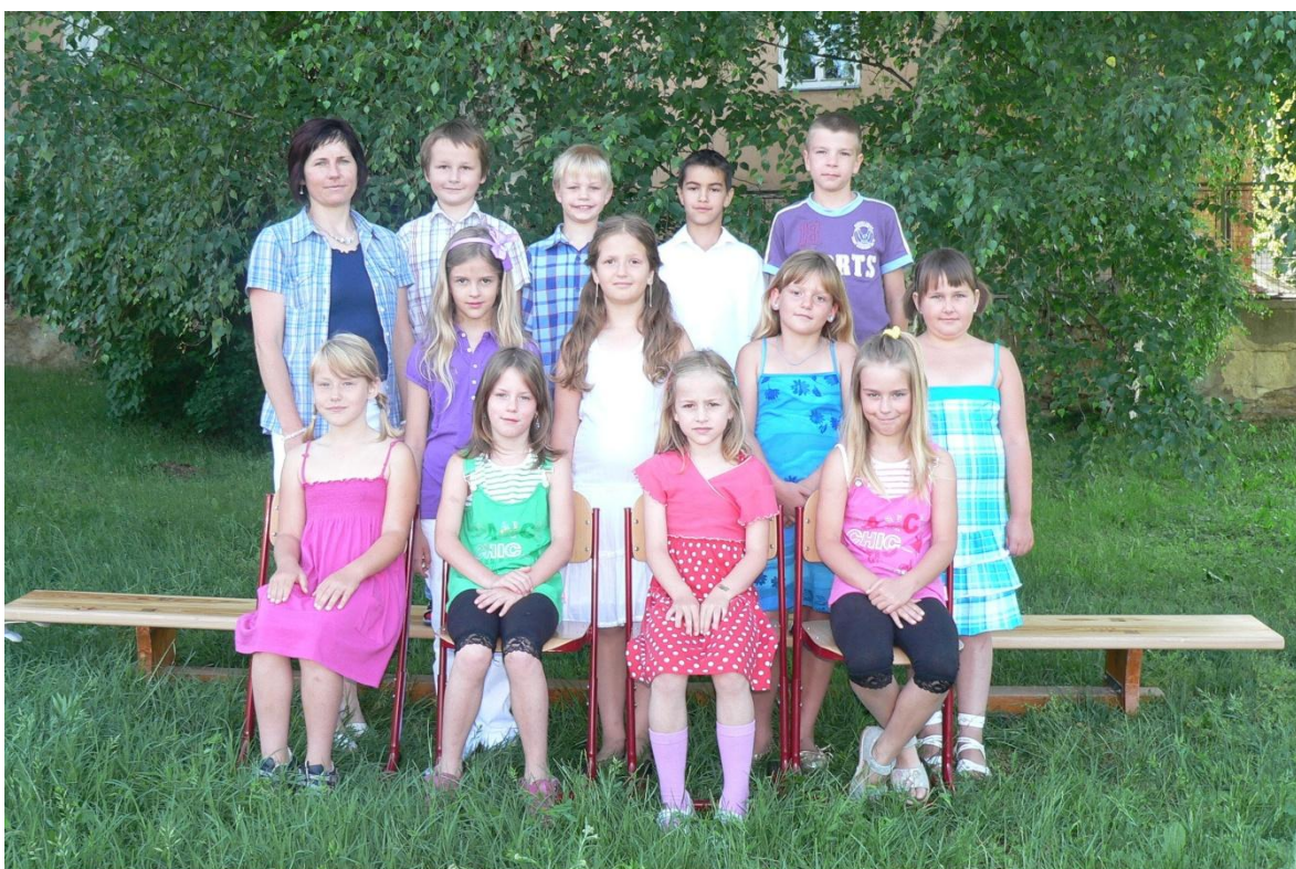
2. třída - 2010/2011